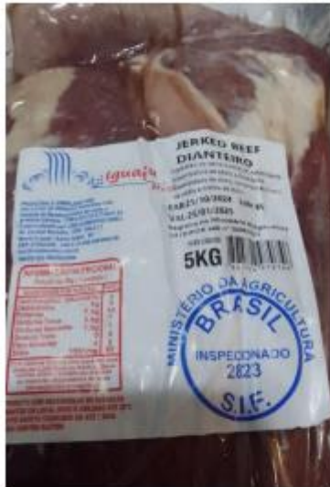
FOTO 01 - Produto na embalagem

Após avaliação do teste acima, do ponto de vista das características perceptíveis do produto, considero a amostra REPROVADA.