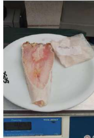
FOTO 10- Pesagem da amostra 01.