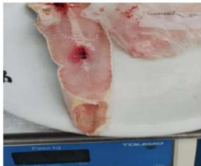
FOTO 11- Pesagem da amostra 02.