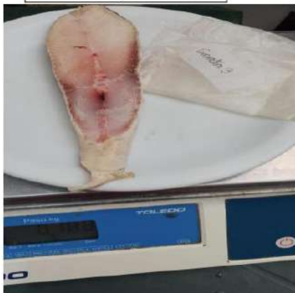
FOTO 12- Pesagem da amostra 02.