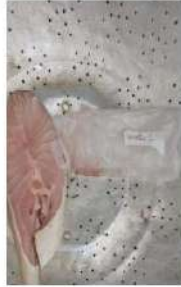
FOTO 8 - Desglociamento da amostra 02.